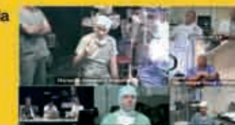
Table ronde multicentre Hannover, Marseille, Beziers, Manchester, Amsterdam, Londres

Ce r seau permet  galement la formation   distance des internes et chefs de clinique gr ce   une session pilote hebdomadaire de vid o-conf rence entre la clinique Causse et le CHU de Utrecht.