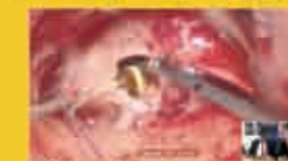
Chirurgie en direct depuis la clinique Causse

Fruit d'une collaboration public-priv , depuis sa cr ation en 2006, le LION a  t  rejoint par plusieurs autres centres d'expertise en Europe et dans le monde tels que Sao-Paulo (Br sil), New York (USA), Bogota (Colombie), Sydney (Australie), Varsovie et Poznan (Pologne), Istanbul (Turquie) y compris du Moyen Orient (Isra l, Jordanie, Egypte, Arabie Saoudite, Syrie etc..).