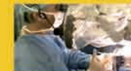
Chirurgie en direct depuis Sao Paulo

Le LION organise chaque ann e des  v nements de formation   l' chelle plan taire suivie de fa on interactive par des milliers de sp cialistes r partis dans des dizaines de salles de video-conf rence   travers le monde. Ces s ances donnent l'occasion de suivre plus d'une trentaine d'op rations en direct. Lors de la 5 me journ e annuelle de mai 2010 plus de 6000 ORL r partis sur les 4 continents ont pu y participer.