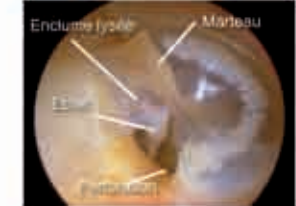
Perforation du tympan avec érosion de l'enclume