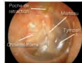
Cholestéatome (masse blanche sous le tympan) provenant de la rétraction en haut