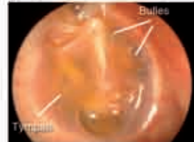
Otite séreuse (liquide jaunâtre et bulles)

L'otite séreuse et l'otite séro-muqueuse sont des affections très fréquentes chez l'enfant mais pouvant aussi se voir chez l'adulte. Elles sont toujours secondaires à un défaut d'aération de l'oreille moyenne impliquant le plus souvent une dysfonction de la trompe d'Eustache. L'épanchement rétro tympanique qui la caractérise est plus ou moins visqueux et entraîne une surdité. C'est une affection qui peut être latente (sans signes nets et parfois découverte par un examen systématique), fluctuante en intensité et dans le temps (souvent aggravée par les épisodes inflammatoires rhino-pharyngés) et transitoire chez l'enfant, avec amélioration au bout de quelques années. Le diagnostic est facile quand l'otoscopie montre la présence de liquide souvent jaunâtre derrière le tympan et s'accompagne d'une surdité de transmission à l'audiométrie et d'une tympanométrie plate. En cas d'échec du traitement médical il faut souvent discuter la pose d'aérateurs (aérateurs ou drains transtympaniques, diabolos, yoyo) sous anesthésie générale chez l'enfant le plus souvent associée à une adénoïdectomie (ablation des végétations). Il faut dans tous les cas rechercher et traiter la cause ou les facteurs favorisants (allergie ..) pour éviter les récurrences après chute du drain.