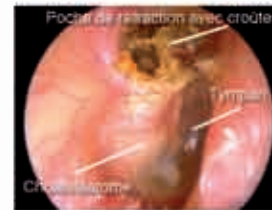
Cholestéatome (masse blanche sous le tympan) provenant de la rétraction en haut