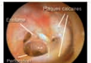
Perforation du tympan avec plaques calcaires