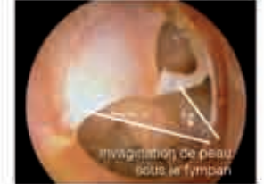
Perforation du tympan avec invagination de peau