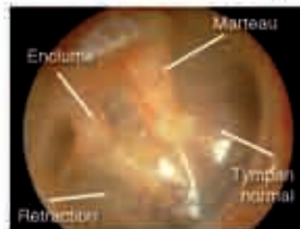
Rétraction du tympan contrôlable avec accolement à l'enclume

Ailleurs et en particulier en cas de surdité de transmission marquée, d'apparition d'infections et surtout disparition otoscopique du fond de la poche, il faut pratiquer une tympanoplastie plus complète par voie postérieure pour parfaitement contrôler l'éradication de la peau de l'oreille moyenne avec souvent ossiculoplastie associée. Dans tous les cas la surveillance est très longtemps prolongée, cliniquement à l'affût d'une éventuelle récurrence de la rétraction et aussi par imagerie d'un éventuel cholestéatome dans la profondeur.